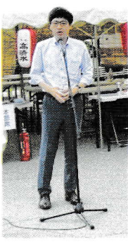
沼谷純 秋田市長のご挨拶