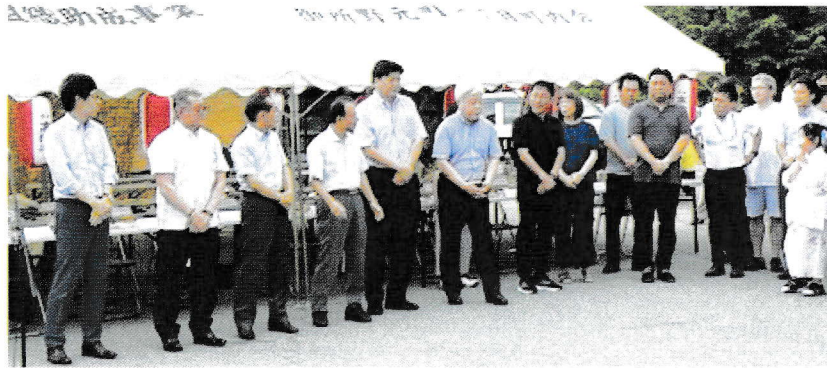
ご来賓のみなさま

今年は、盆踊りの参加者も例年より多く、また各町内の栈敷席も例年以上に賑わっていた様子でした。